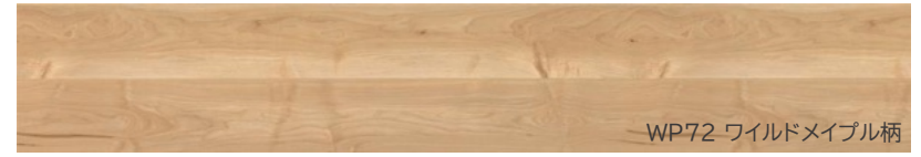
WP72 ワイルドメイプル柄