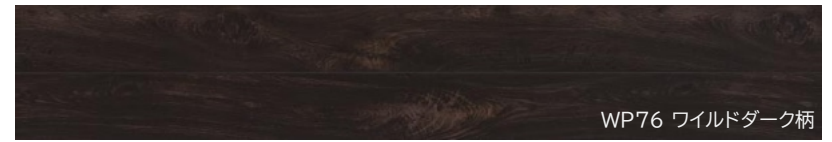
WP76 ワイルドダーク柄