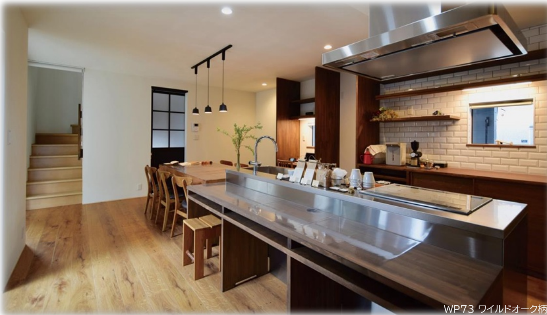
WP73 ワイルドオーク柄