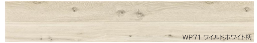
WP71 ワイルドホワイト柄