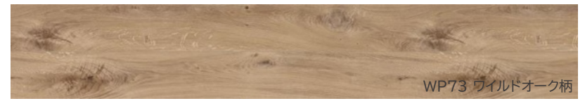
WP73 ワイルドオーク柄