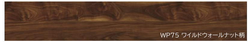
WP75 ワイルドウォールナット柄