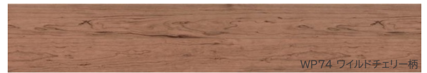
WP74 ワイルドチェリー柄